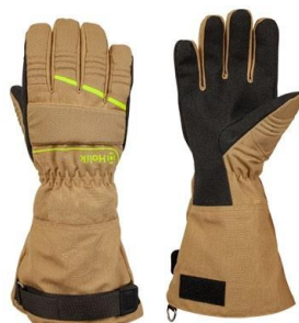
Crystal Long Beige