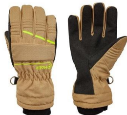
Crystal Evo Beige