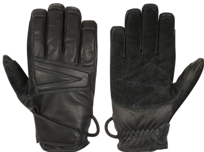
Rency Fast Rope