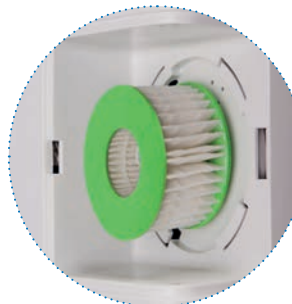
Vzduchový filtr (Nachází se za krytem)