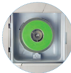
Vzduchový filtr (Nachází se za krytem)