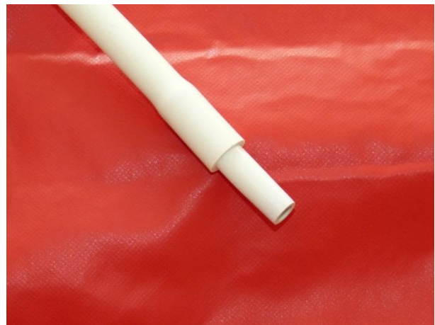
Stará koncovka vakuové pumpy