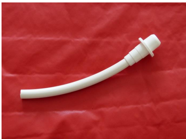
Redukce s koncovkou pro ventil Carmo