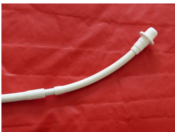
Po napojení redukce na starou koncovku