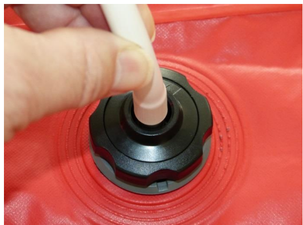
Přidržení hadičky při odsávání