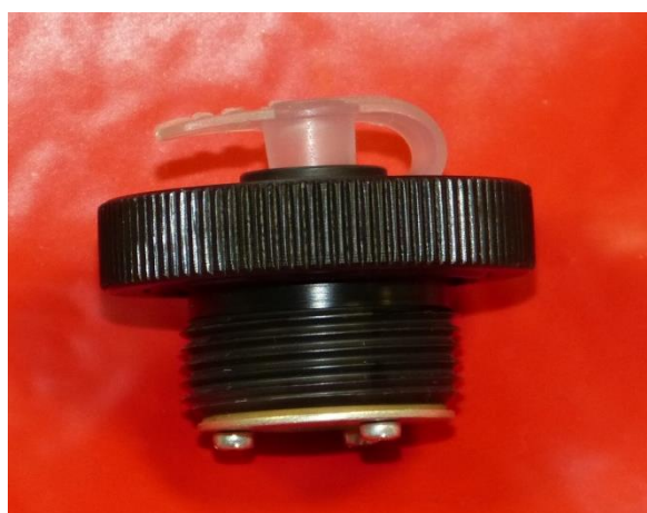
Původní ventil EGO