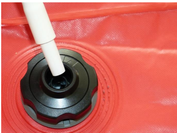
Nasazení staré koncovky do ventilu Carmo