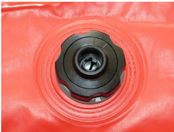
Nový vakuový ventil Carmo