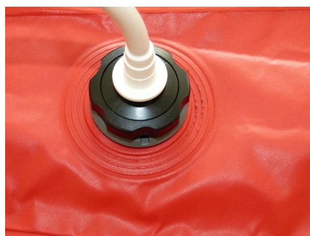
Připojení originální koncovky na ventil Carmo